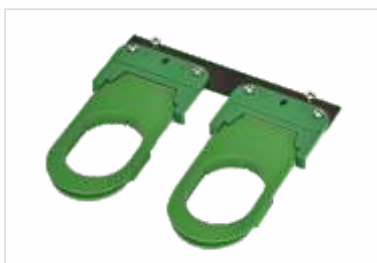
Bastidor para Peúgas