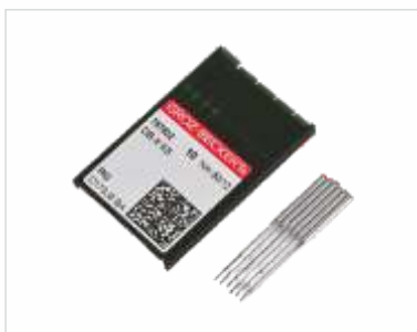
Embalagem com Agulhas