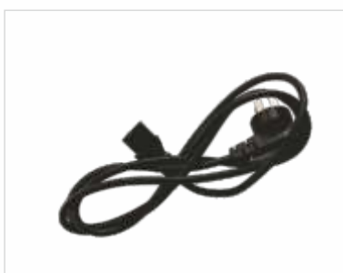
Cabo de Corrente