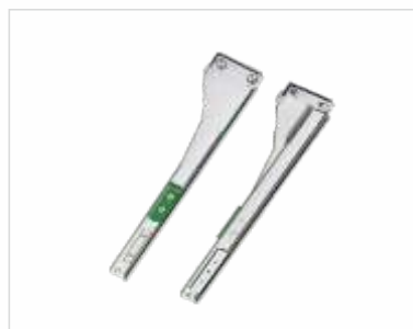
Suportes laterais de bastidor