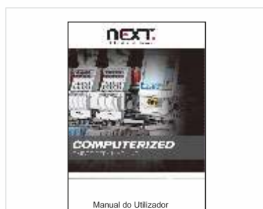
Manual de Instruções