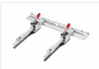
Bastidor para Calçado