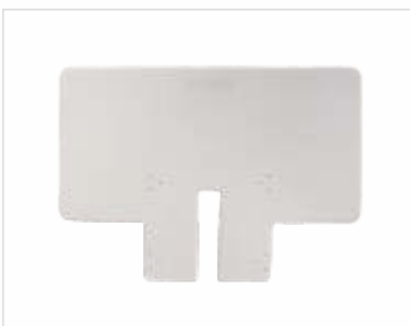
Mesa de apoio ao bastidor